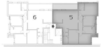
דירה 6 היא תמונת ראי של דירה 5