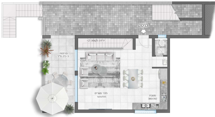
*גינה פרטית בהתאם לתכנית פיתוח

דגם ירקון קומה 1- 6 חדרים + *גינה פרטית + מרפסת שטח דירה 160 מ"ר