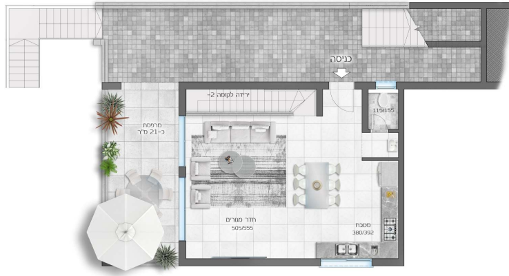
*גינה פרטית בהתאם לתכנית פיתוח

דגם ירקון קומה 1- 6 חדרים + *גינה פרטית + מרפסת שטח דירה 160 מ"ר