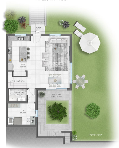
יגנה פרטית בהתאם להגזית פירוט

דגם שור קומת קרקע 5 חדרים + יגנה פרטית + מרפסת שטח דירה 158 מ"ר