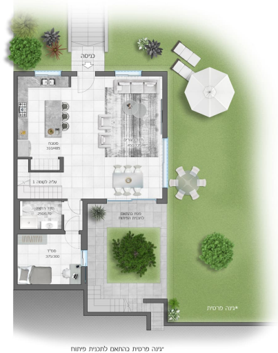
יגנה פרטית בהתאם להגזית פירווח

דגם שור קומת קרקע 5 חדרים + יגנה פרטית + מרפסת שטח דירה 158 מ"ר