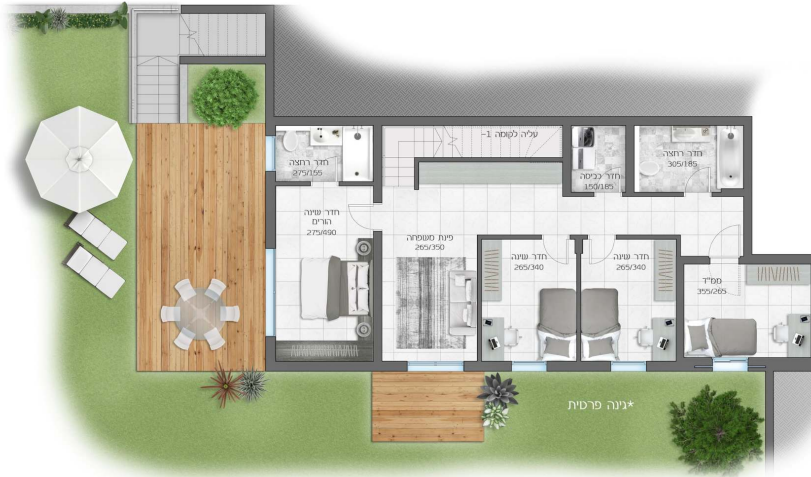
*גינה פרטית בהתאם לתכנית פיתוח

דגם ירקון קומה 2- 6 חדרים + *גינה פרטית + מרפסת שטח דירה 160 מ"ר