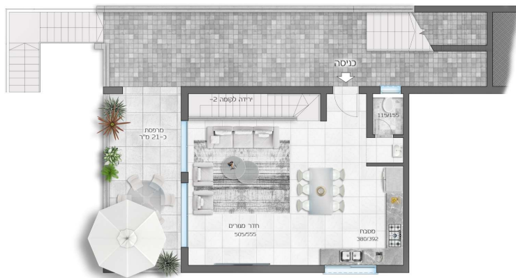
*גינה פרטית בהתאם לתכנית פיתוח

דגם ירקון קומה 1- 6 חדרים + *גינה פרטית + מרפסת שטח דירה 160 מ"ר