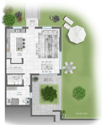
יגנה פרטית בהתאם להגנית פיתוח

דגם שור קומת קרקע 5 חדרים + יגנה פרטית + מרפסת שטח דירה 158 מ"ר